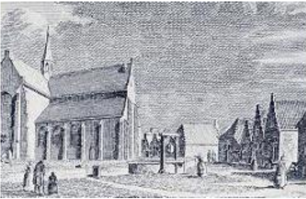
Haamstede in 1745.